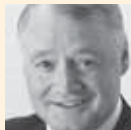
Urs W. Studer Stadtpräsident der Stadt Luzern