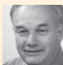
Christian Wanner Präsident der Finanzdirektoren- konferenz FDK; Regierungsrat des Kantons Solothurn, Vorsteher des Finanzdepartements