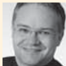
Klaus Tschüscher Regierungschef des Fürstentums Liechtenstein, zuständig für die Resorts Präsidium, Finanzen, Familien- und Chancengleichheit