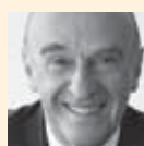
Hans-Rudolf Merz Bundespräsident, Vorsteher des Eidg. Finanzdepartements EFD