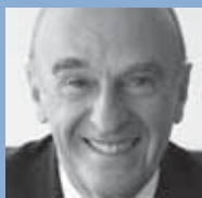
Hans-Rudolf Merz Bundespräsident, Vorsteher des Eidg. Finanzdeparte- ments EFD