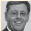
Urs Ursprung Direktor, Eidgenössische Steuer- verwaltung ESTV